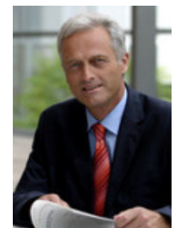
Dr. Peter Ramsauer Bundesminister für Verkehr, Bau und Stadtentwicklung Bewusstsein für Infrastrukturprojekte schärfen - Für eine neue Kultur der Bürgerbeteiligung