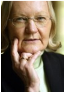
Prof. Monika Harms Generalbundesanwältin a. D. Vorsitzende der Gesellschaft für Rechtspolitik