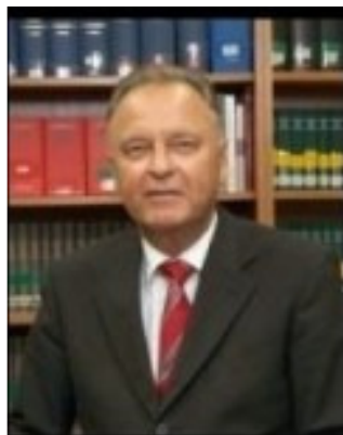
Prof. Dr. Dres. h. c. Hans-Jürgen Papier Präsident des Bundesverfassungsgerichts a.D.