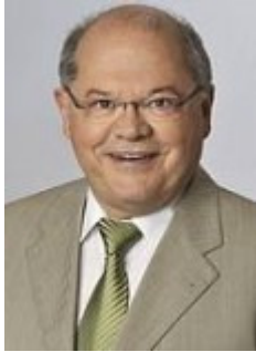
Jerzy Montag, MdB Rechtspolitischer Sprecher der Bundestagsfraktion Bündnis 90/DIE GRÜNEN Moderation Diskussion