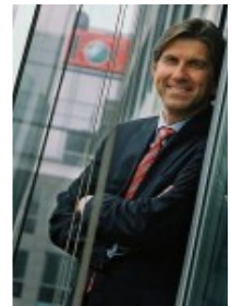
Dr. Wolfram Weimer Journalist, Publizist Dinner speech: Die schillernde Berliner Medienrepublik – Demokratiewandel durch Massenkommunikation