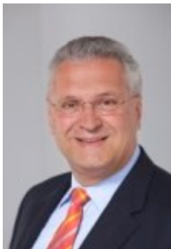
Joachim Herrmann Innenminister des Freistaats Bayern Podiumsdiskussion