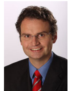
Prof. Dr. Günter Krings, MdB Stellvertretender Fraktionsvorsitzender der Bundestagsfraktion CDU/CSU Moderation Diskussion